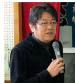
(三重大 川口准教授)