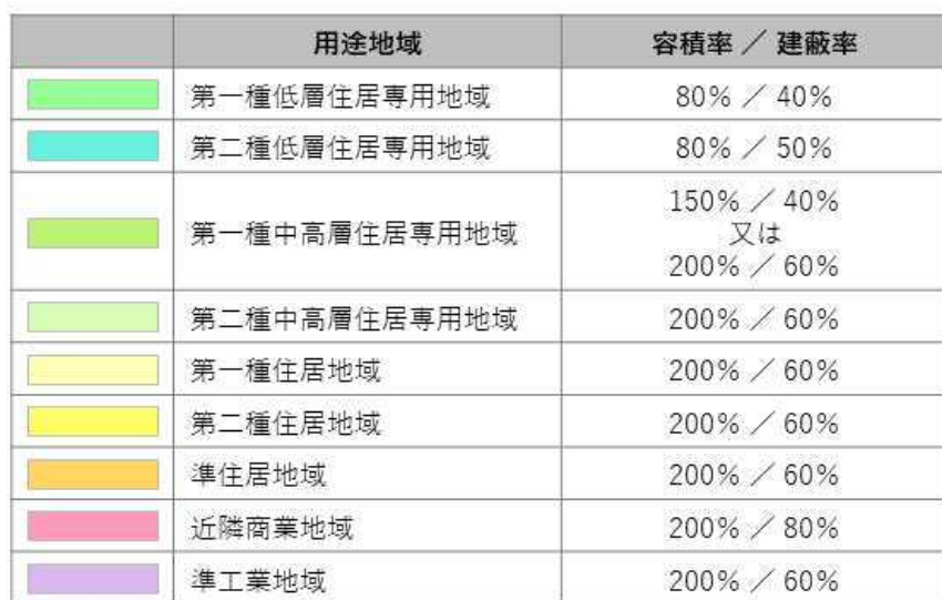
図 4-3 平岡3条5丁目地区周辺の用途地域指定状況