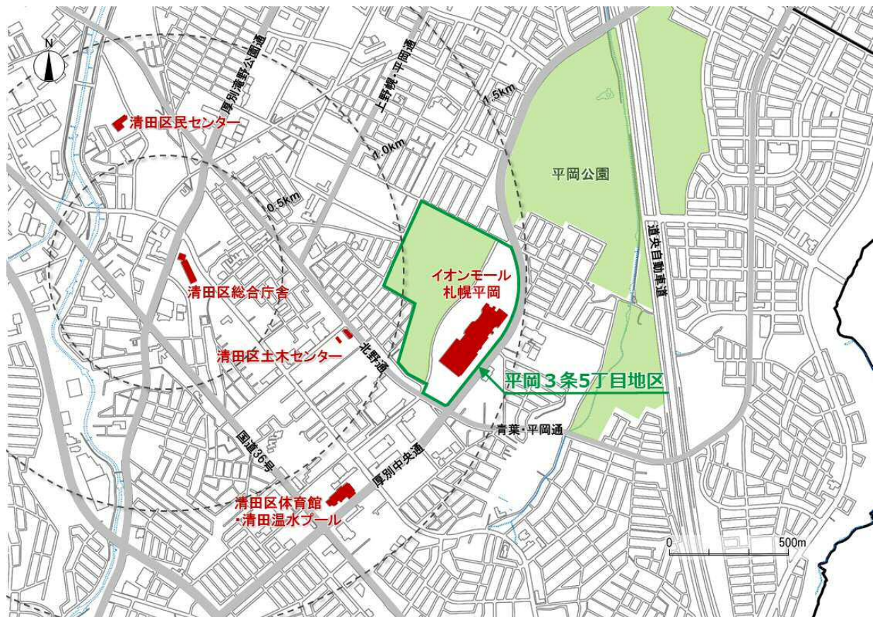
図 4-1 平岡3条5丁目地区の位置

平岡3条5丁目地区は、『清田』の中心部から約1kmの位置にあります。当地区は住宅地に囲まれており、周辺には、梅の名所として知られる平岡公園や、市有施設である清田区体育館・清田温水プールなどが立地しています。