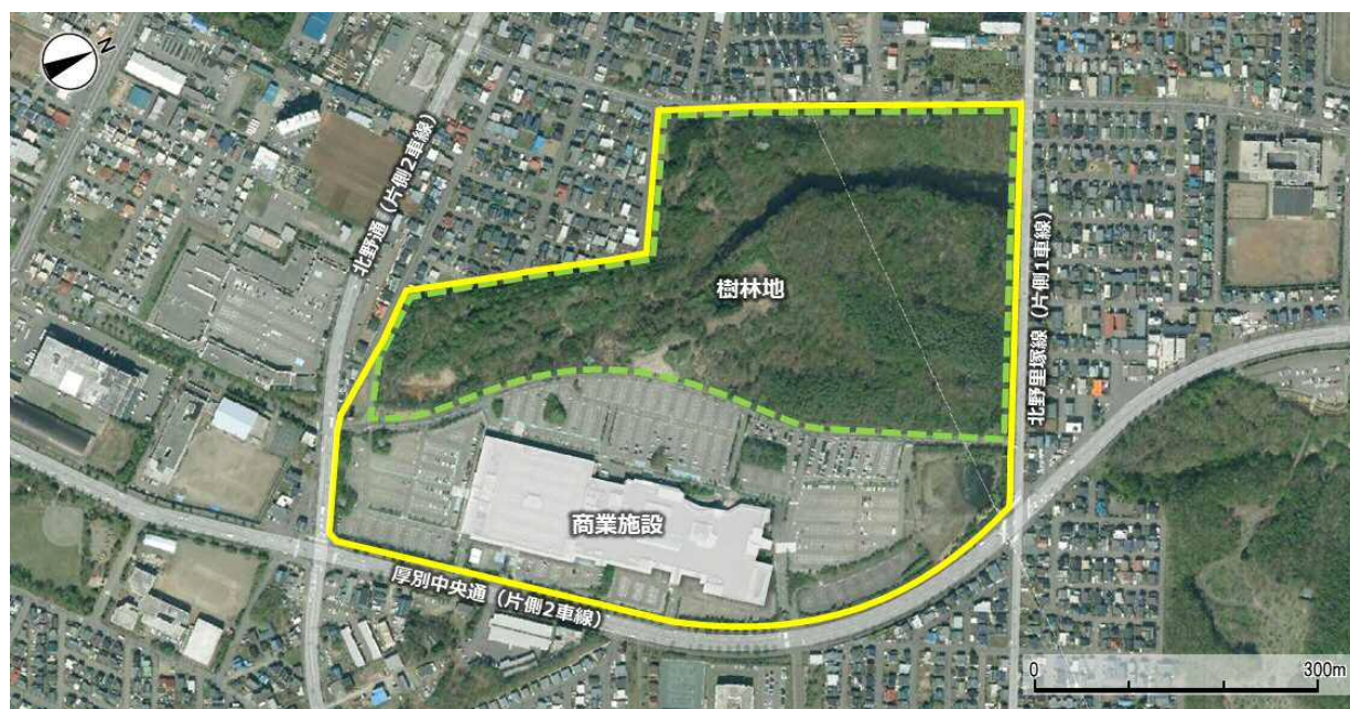
図4-2 平岡3条5丁目地区の航空写真

平岡3条5丁目地区の西側には、戸建て住宅地に囲まれるような形で、約16.7haの樹林地が広がっています。この樹林地は、「札幌市東部地域の街づくりに関する協定書」等に基づいて自然環境の保全が図られてきたことから、現在も開業前からの姿を維持しており、トドマツやシラカバなどが生育し、中央には南北方向に伸びる水辺があります。また、エゾホトケドジョウ（準絶滅危惧 ※5 ）やサルメンエビネ（絶滅危惧Ⅱ類 ※6 ）、トケンラン（絶滅危惧Ⅱ類）などの貴重な動植物が生息しているほか、アオサギの繁殖地にもなっています。