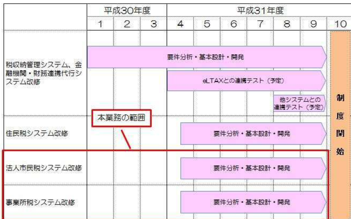
図 2 全体スケジュール（地方税共通納税システム対応）