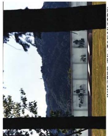
植村直己冒険館 (設計: 栗生総合計画事務所) 情報の刷り込まれた壁面