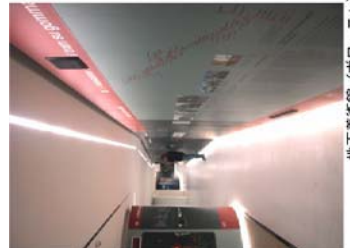
地下美術館 (水ロニーヤ) 長い壁面を利用した展示