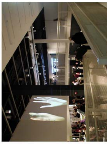
MOVIA QMS (アメリカ) 可変する映像 (アート・広告・環境映像) の投影