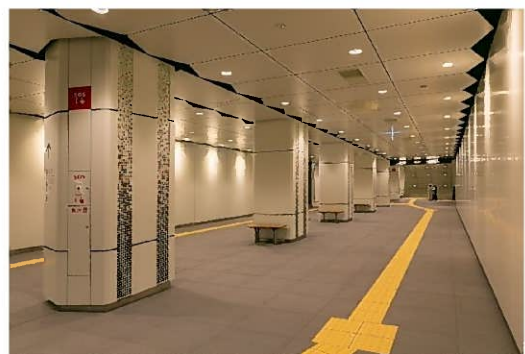
▲西 2 丁目地下歩道内部