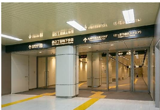
▲西 2 丁目地下歩道入口