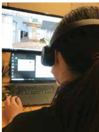
▲テレワークを使った作業の様子