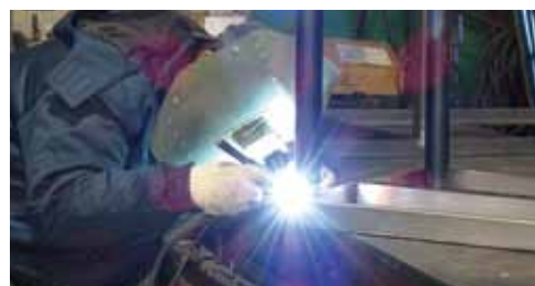
溶接技術者は資格取得も目指して