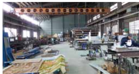
溶接・組み立てを行う第3工場