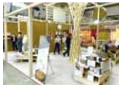
共同コンセプトブース(2022年)

全国のバイヤーに対し、北海道らしいモノヤコトのPRをする絶好の機会を是非ご活用ください。