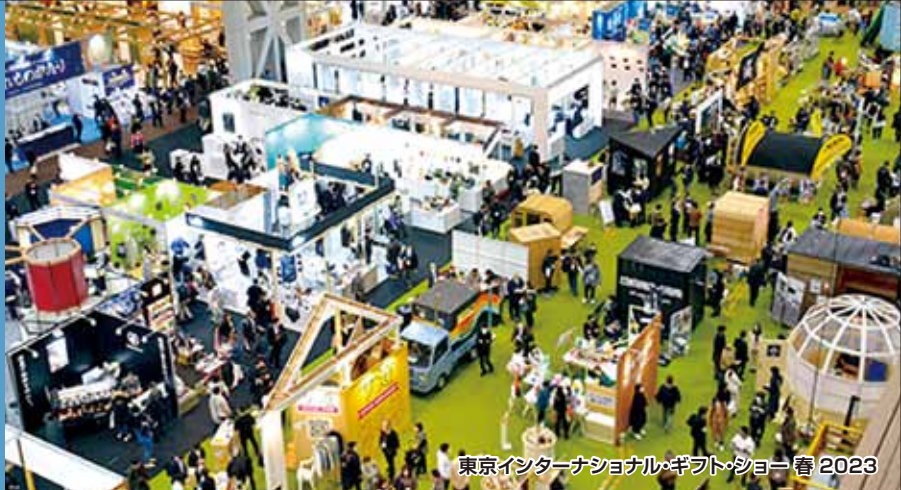
東京国際ギフトショー春2023