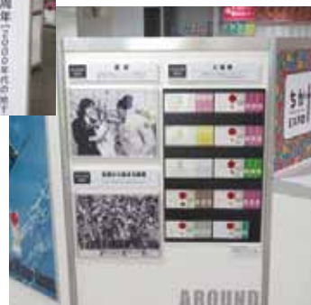
オーロラスクエアの様子▶