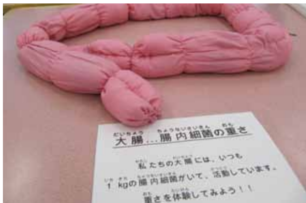
消化管体験ツアーでは重さ1kgの布製の大腸を体験できます。