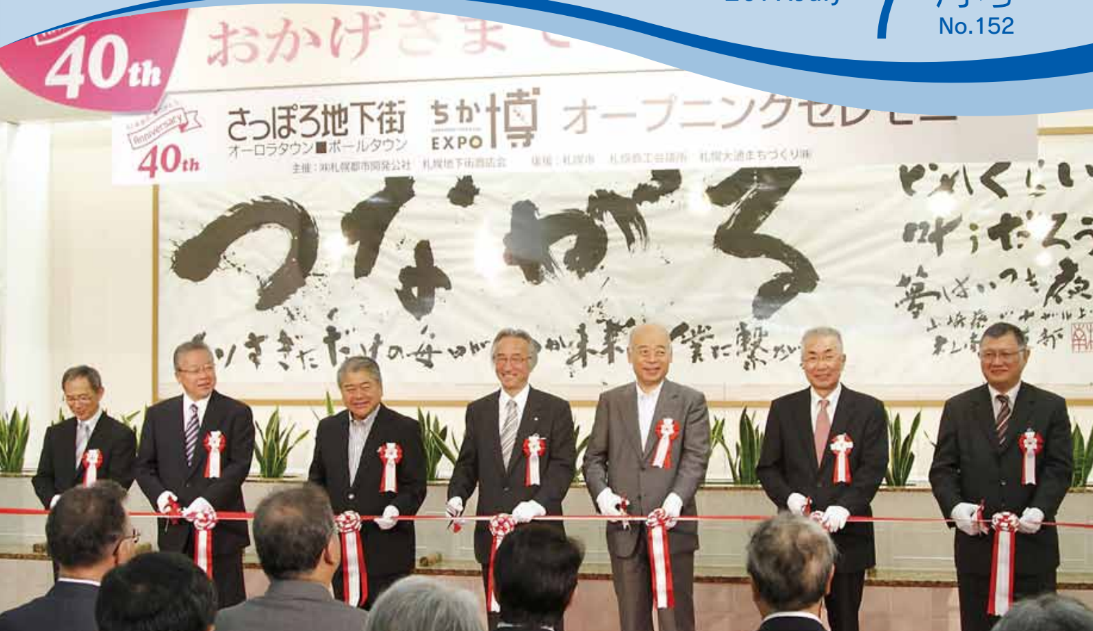
▲ 6月11日に行われたさっぽろ地下街 40周年記念歴史パネル展「ちか博 EXPO」のオープニングセレモニーの一幕。