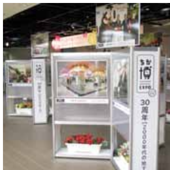
◀オーロラプラザの様子

さっぽろ地下街では、40 周年記念事業として、このほか公共通路床やトイレの改修なども行っており、より快適なお買い物空間として、リニューアルを遂げています。開業 40 周年を迎え、これからもますますパワーアップするさっぽろ地下街に大注目です!