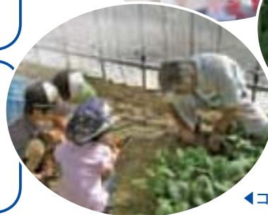
◀コマツナ収穫体験