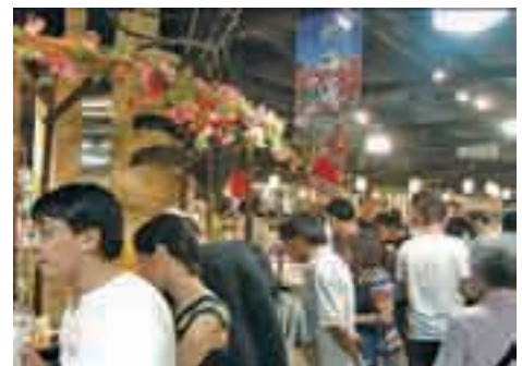
2008年香港シティ・スーパー北海道フェアの様子