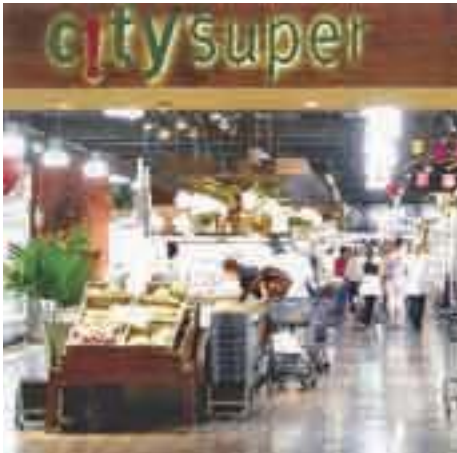
香港シティ・スーパー店内の様子

2009年6月18日(木)～19日(金)の2日間、香港シティ・スーパーのバイヤーを招いて商談会を開催しました。この商談会は、香港シティ・スーパーの4店舗で開催する「北海道フェア」(期間:2009年8月31日から9月17日まで)に先立ち、札幌や北海道の食の魅力を企業からバイヤーに直に説明し、知ってもらうために実施しました。今回は昨年に引き続き2回目の実施で、商談会参加企業数は44社と多くの企業に参加いただきました。