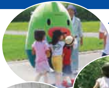
◀さとらんどキャラクター “くんくん”

その他にも様々な展示が盛りだくさん。 ジャガイモ・トウモロコシの試食もあります。