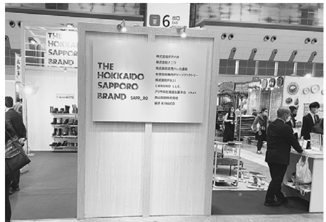
北海道・札幌ブース