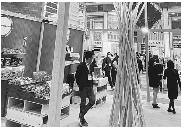
札幌市観光商材ブース