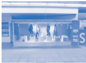
<札幌スタイルショーケース>