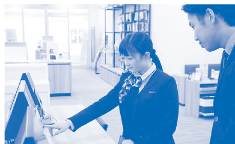
シスター・ブラザー制度の様子

そのほかには、職場を働きやすい環境にする取り組みにも力を入れています。例えば、商品の棚卸し時間を短縮し残業時間の軽減につながるための設備投資や、約1年半前から多様な働き方を導入したことにより、有給や休憩時間をスムーズに取得できるようになりました。福利厚生に関しても社員の意見を尊重し、求められる福利厚生が提供できるよう、社を挙げて取り組んでいます。これらの取り組みにより職場定着が促され、良い職場環境により温かな接客を提供できていると言えます。