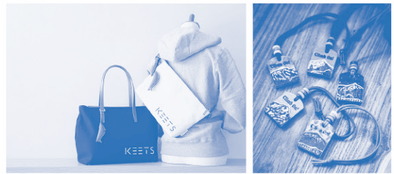
<2018年度の認証製品(一例)>