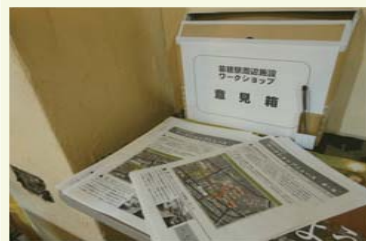
＜苗穂駅周辺まちづくり協議会に設置した意見箱＞

◆札幌市ホームページ： http://www.city.sapporo.jp/keikaku/partnership/naebo/p_naebo.html ※札幌市役所ホームページ内のキーワード検索で「苗穂駅周辺地区のまちづくり」と入力して検索することもできます。