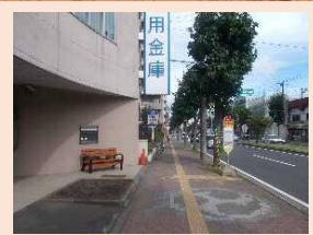
座りながらバス待ちができるよう、空知信用金庫・北洋銀行にご協力いただき、バス停の前にも2か所設置しました。