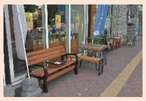
人気のカフェでは、屋外で密にならずに飲食できるよう、道路占用の取組とあわせてテーブルやベンチを設置しています。