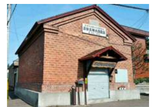
旧中井家リンゴ倉庫

代表的なものとして、札幌景観資産にもなっている旧中井家リンゴ倉庫（平岸3条2丁目）は、現在は商店街の事務所と、太鼓道場として地域の人々に活用されています。また、サッポロ珈琲館平岸店（平岸2条6丁目）は、リンゴの選果場であった建物を再利用し、当時の趣きをそのまま活かしたお店になっています。