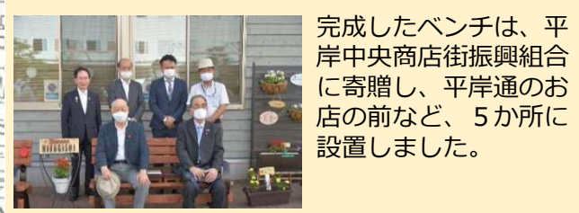
完成したベンチは、平岸中央商店街振興組合に寄贈し、平岸通のお店の前など、5か所に設置しました。

昨年度実施した「平岸の未来づくりワークショップ」などでもご提案のあった、「ベンチがあったらいいのに！」というアイデアをもとに、平岸中央商店街振興組合と連携し、プロジェクトを実施しました。