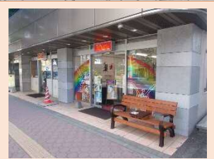
地域交流サロン「ぴらけし」の前にも設置しています。