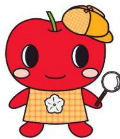
「こりん」 リンゴをモチーフにした キャラクター