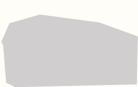
建物の外観シルエット！？