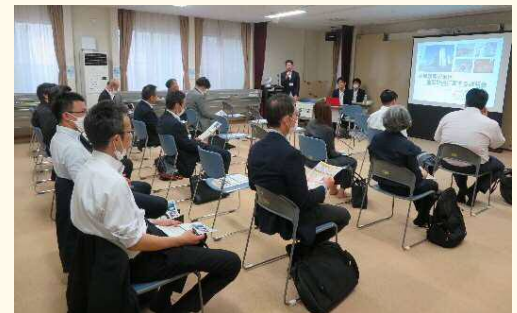
地域説明会（令和5年6月23日）の様子

札幌市公式ホームページでも、地区計画の情報を更新していますので、建物の更新を検討している皆様におかれましては、ご覧いただき、札幌市地域計画課までご相談ください。