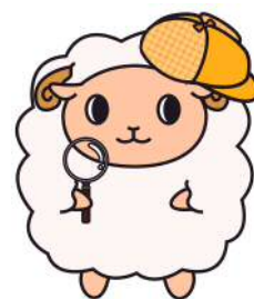
「めーたん」 羊をモチーフにした キャラクター