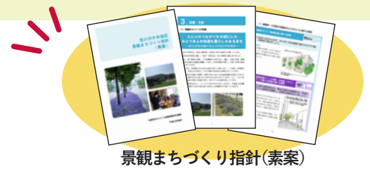
景観まちづくり指針(素案)