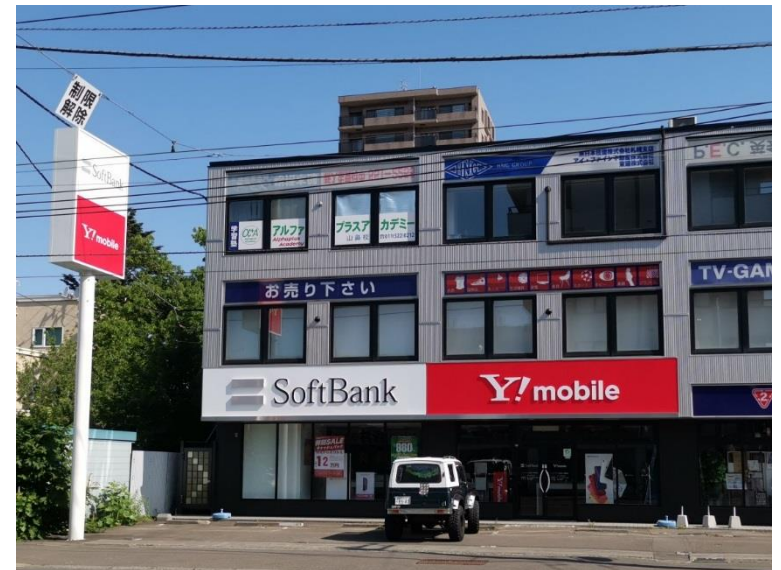
通常の広告物（市内某所）