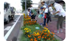
国道12号花いっぱいプロジェクトで植えた花壇

まちの良いところを活かして、みんなに親しまれるまちなみがつくられることで、地域の魅力がUP！