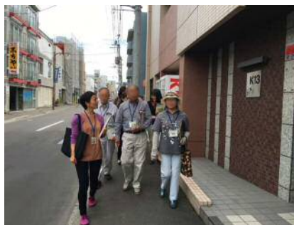
西屯田通りは個性的なお店がいっぱいありますね!