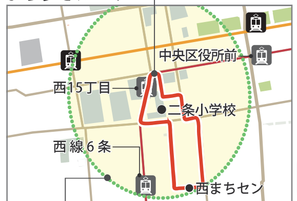
西15丁目電停周辺の指針の対象として考えられる範囲