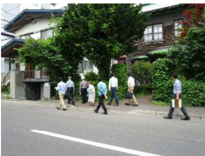
歩いてみると思った以上に緑が多いですね。