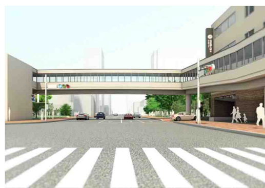
空中歩廊イメージ