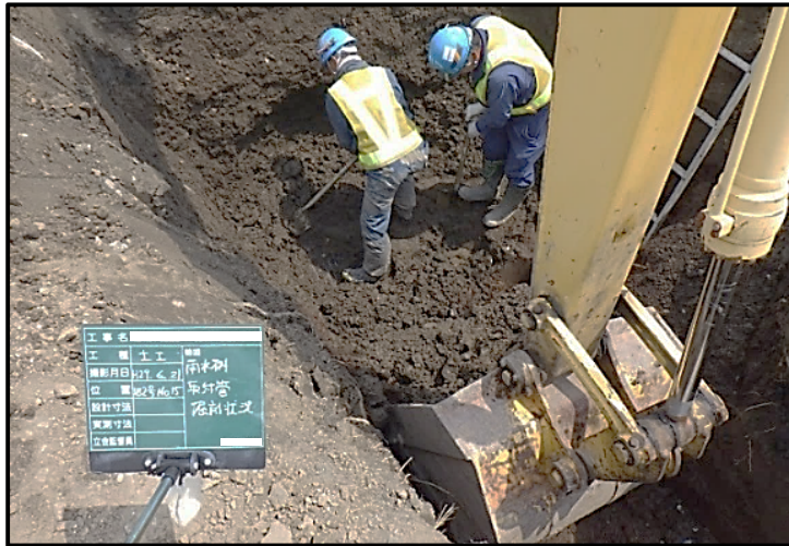
図3 車両系建設機械の不適切な作業の事例