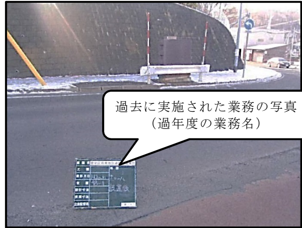
図4 道路維持作業除雪業務の不適切な写真の事例