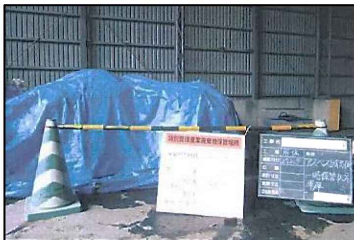
図5 非飛散性アスベスト廃棄物の適切な保管の事例