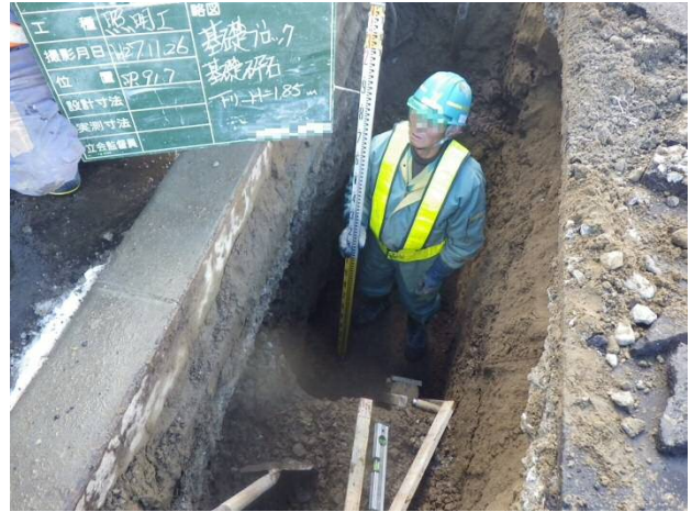
土留工を設置していない事例