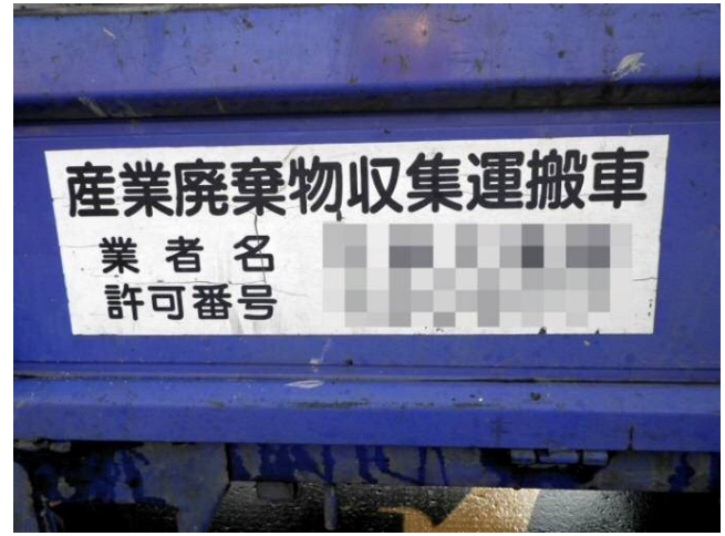
図3 産業廃棄物収集運搬車の表示事例