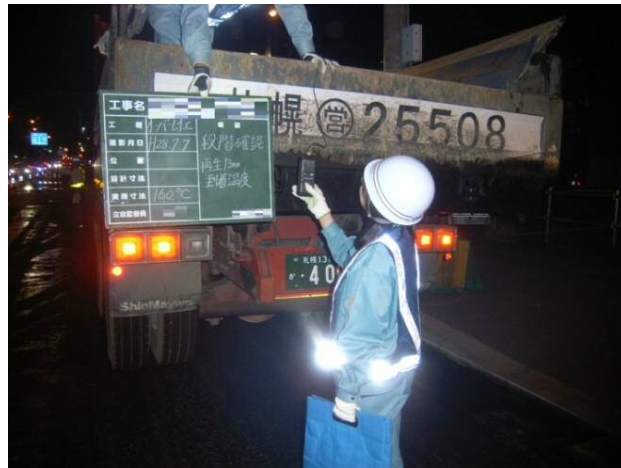
図4 反射ベストの着用事例