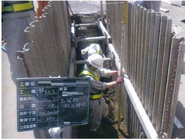
土留工を設置した事例