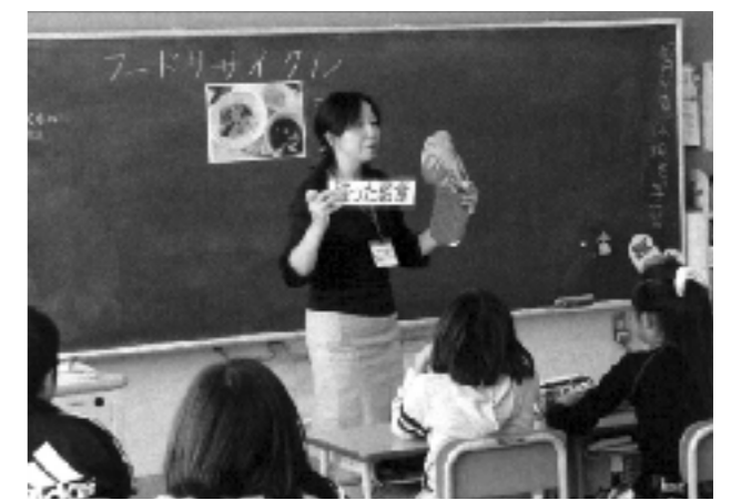
フードリサイクルについての授業風景

無駄をなくすために、野菜くずを減らすまたは利用するというを「給食だより」でお知らせすることで、家庭や地域への啓発にもなっている。「地産地消(フードマイレージ)」などの言葉を、より身近なものにすることを目指して広く啓発を行っている。毎日積み重ねていくこと、継続していくことが大切であり、特別なことをしなくても「こんなことで〇〇が節約できた!」などの行動を日常的にできるようになればよいと考えている。