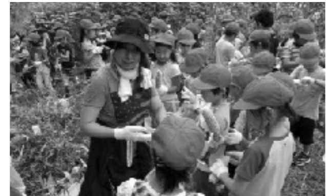
トウモロコシの収穫

また、地域でとれたものを給食に使用しているときは、栄養教諭が給食を食べる前に紹介している。その他にも、給食だよりで家庭で役立つ情報を掲載し、家庭への啓発活動にも取り組んでいる。