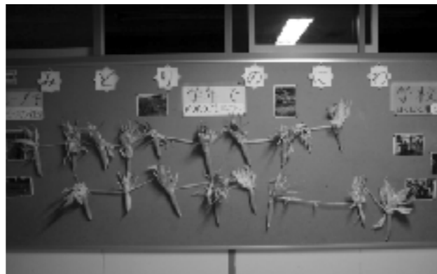
乾燥中のトウモロコシ

本校では、食物の循環の学習及び人とのふれあいを目的に、生活科や総合的な学習の時間を利用して全校で野菜の栽培に取り組んでいる。栽培は地域住民から寄贈された約300坪の畑で行っており、「緑の庭」と名付けられている。