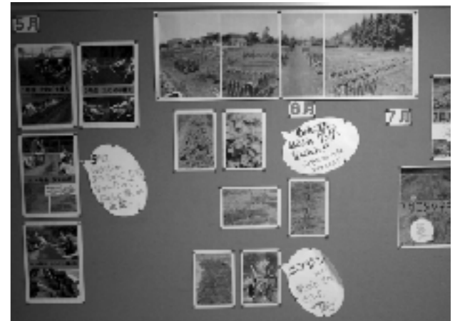
作物の成長のようす

環境学習は、実際に触れて体験させることが最も重要である。1年生から6年生まで、発達段階に合わせながら、近隣の公園の自然など、児童にとって身近なものを教材として使いながら、環境学習に取り組んでくることが大切である。