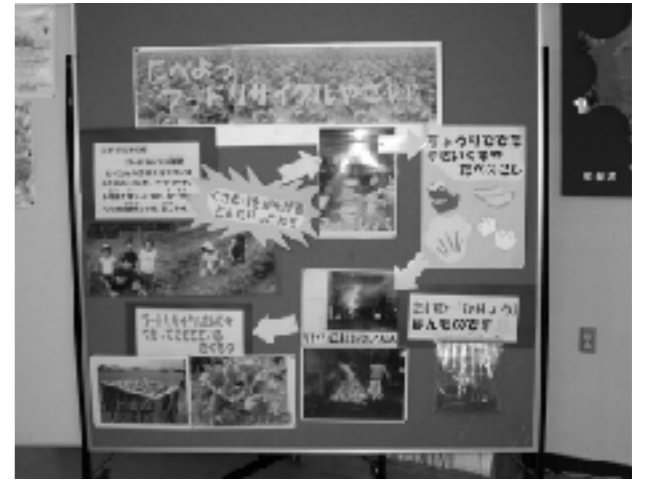
「実物」の堆肥を掲示

種植えから収穫、堆肥まきを体験することで、フードリサイクルの流れや食物を栽培する苦労を実感している。また「とれたてや自分で作った野菜はおいしい」という反応もある。給食親学校の栄養士さんと連携し、学年毎に1学期と3学期に食育の授業を行い、収穫して食べることで児童は楽しみを覚え、栽培活動に前向きに取り組んでいる。