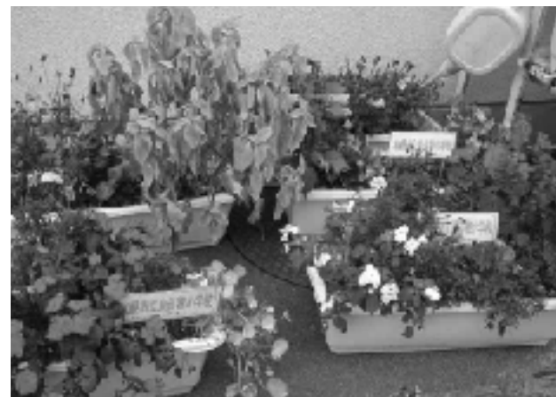
校舎正面のプランター

「太陽農園」と名付けられた農地で、野菜栽培をとおして食育・生物・環境など幅広い分野の学習に全校で取り組んでいる。きっかけは農園移転。平成7年に学校近くの広大な土地に学校農園が移転し地域から畑おこしやタマネギの苗の提供などの支援をいただいていたが、平成22年に再度移転。用地もさらに広くなり野菜栽培活動を土づくりから始めることになった。親子の植栽活動「花トピア」にずっと取り組んでいることもあり地域や保護者に支えられて幅広い活動が展開されることになった。