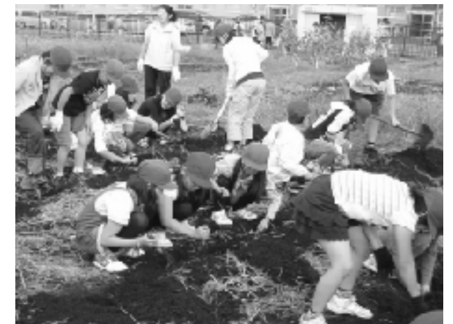
太陽農園での米ぬか堆肥づくり

本校では、1年生から6年生までの6年間取り組むことにより、子供たちに農園での活動やフードリサイクルが、日常のこととして自然に身に付いている。自分自身の手で栽培することで、野菜への愛着や育てる楽しみが生まれ、苦手な野菜を食べることができるようになった子どももいる。このように、農園での活動を通して、フードリサイクルについて体験しながら学習することで、教科書だけでは得られない様々な効果が得られている。