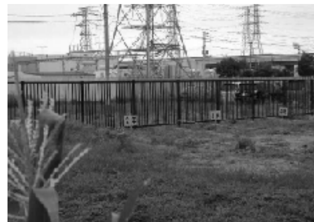
学年ごとに分けられた畑