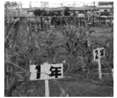
とうもろこし栽培

収穫で余ったものや調理実習で出た野菜くずは、秋の収穫が終わって畑の掃除をするときに米ぬかとともに畑の土にまぜ、土づくりに役立っている。春にはフードリサイクル堆肥を土へ。堆肥に触れるということとはめったにないことなので、子供たちは高い関心を示し、おもしろそうに取組んでいる。