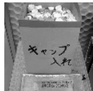
ペットボトルキャップの回収

場所の確保と集めたものを回収拠点へ運搬する作業に苦勞しているのも現状。生徒の発案で始まった取組を、継続させたり、広がりをもたせたりするためには工夫が必要だと感じている。