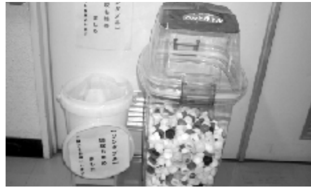
ペットボトルキャップ回収ボックス