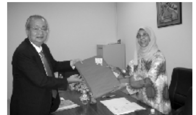
クウェートの公立学校とポスターを交換

よう」との感想や意見があり、貴重な体験を通して、新たな課題に向けて取り組む意欲が高まったようだ。