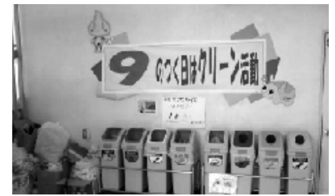
「クリーン活動の日」ポスター

また、本校ではパッケージプログラムを活用し、全校児童が自然エネルギーを利用したさまざまな体験をしている。学年ごとに段階的に取り組むことで、学習が深まるよう工夫している。