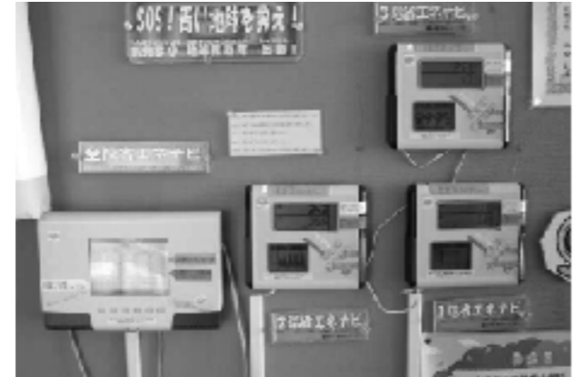
エネルギーの消費量と目標値が表示される「省エネナビ」

まず、家庭での電気・ガス・水道使用量の実態を1~2週間かけて調べ、家族で話し合い、無駄な使い方を発見・反省し、今後の計画を立てて実践・改善する。さらに2週間経過後、前に調べた数値と比べてどのような効果があったかとりまとめ、国際芸術技術協力機構キッズISOプログラム事務局に送付し、「全校児童の家庭での電気・ガス・水道使用量をまとめ、どのくらい節約できたか」「足りないところや課題点」などの評価を受けた。