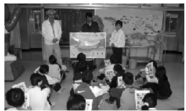
ホタルの生態についての説明

ホタルのエサとなるカワニナは、校内のビオトープに生息しており、さらにこのカワニナがエサとしているキャベツやニンジン、ハクサイは、地域のスーパーマーケットから寄付してもらっている。校内の水槽で5齢虫（約1.3cm）まで育つと、さなぎになる。冬を越え成長を続けたさなぎは、6月には成虫=いわゆる「ホタル」の姿になり、この時期に、区役所裏のビオトープ（高学年）と本校のビオトープ（1年生と特別支援学級）への放流式を行う。夏場には「観賞会」として、参加者を募り、教師や保護者が案内役となって、夜、ホタルが光る姿を楽しんでいる。