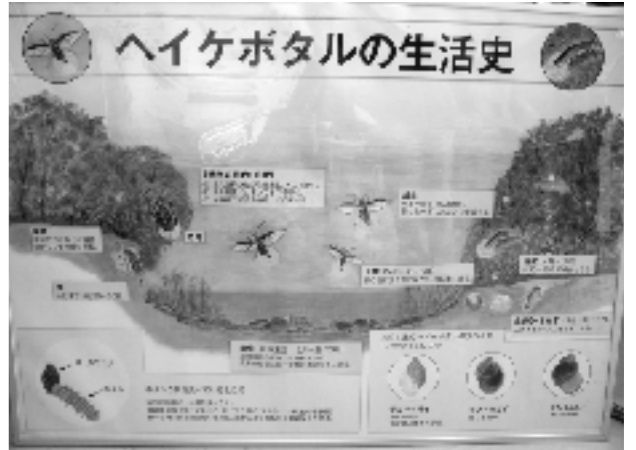
ヘイケボタルの生活史

専門家（本校では「清田区ホタルの会」）から学ぶことや、誰が責任をもって育て、関わっていくかを組織化しておくことが大切。また、子供たちへの意識付けや地域の方々の関心を引き、協力を得るためにも、7月に行われる観賞会は地域へもPRして大切にしている。