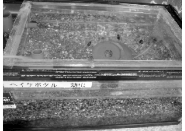
ヘイケボタルの幼虫とカワニナ

子供たちは、ホタルに対し「自分で育てている」という愛着心が生まれ、「少しでも環境が崩れるとホタルが死んでしまう」ということを学んでいる。ホタルが生きるためのきれいな水について興味をもち、考えることから、環境に対する意識は高く、「身のまわり、地域を大切にしよう」という気持ちが育っている。また、ホタルの生態について、外部の人や教師に説明ができるほどに詳しくなっている。