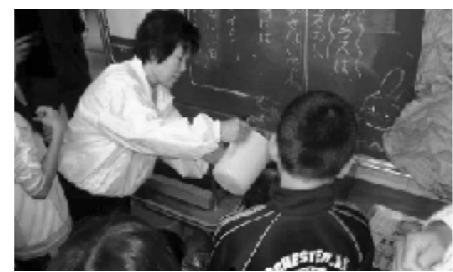
ホタルの幼虫を水槽へ