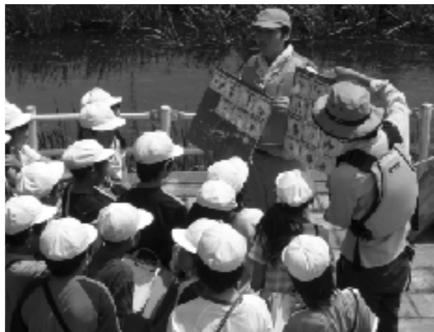
創成川の観察のようす①

川での学習は、道の開発局の方から指導を受け進められた。まず、川のかたちや川へ近づくときの注意点について、パネルを使って説明を受ける。実際に開発局の方が川に入り、その深さを見せてくれた。胸のあたりまで水が迫る場所があり、児童は驚きの声をあげていた。児童が川に入って観察することもできるが、本校では安全面を考えて児童を川へ入らせなかった。その後、グループに分かれてパックテストや透視度（水のにごり具合）を測って水質を調べたり、川に住む魚の観察や、魚と川の水との関わり、川に来る鳥の特徴などを学んだ。