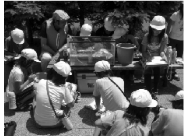
創成川の観察のようす②

川での学習の際は、安全面をしっかりと確保することが大切。特に危険な場所でも、屋外で学習をする際は必ず安全を確認しなくてはならない。