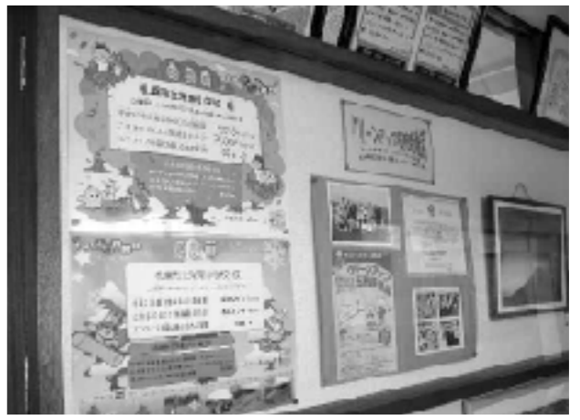
エコに関する掲示物

集まったものを「エコキャップ推進協会」に送付し、受領個数、何人分のワクチンにあたるかと、焼却しなかったことで抑えられたCO2の量(kg)を受領書で確認していた。これからは、この活動が児童会も、より深く関わりながら活動できるようにしていく。