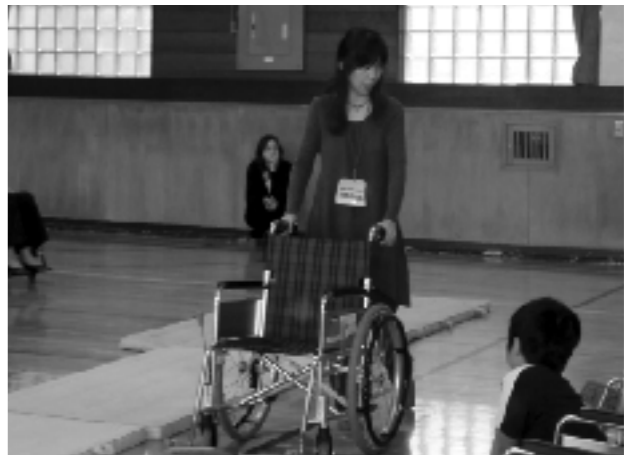
社会科の学習風景

5年生の社会科の学習で、地域の施設を見学の際、「障がいのある人にとって暮らしやすい街」について考える授業を実施している。過去には、地域の障がいのある人の施設へ行き、車いすの方との交流を行った。「皆にとって優しい街づくり」をすることの大切さを考え、これからの未来のために地球にも優しくしようと、地球環境を考える意識が生まれ始めた。このように、身近なことからつなげていくことで、子どもはしっかりと目的をもって行動するようになってきている。