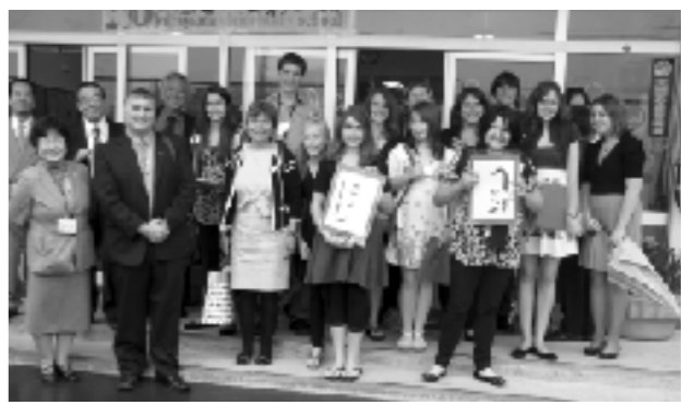
カナダサーモン交流団のみなさん

本物から学ぶということは、子供たちに新たな物の見方を与えることができ、世界中の環境の大切さを見直し、尊重していこうという意識を育てていくことが大切である。