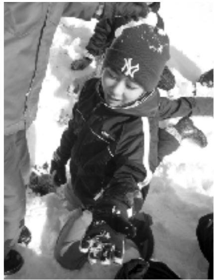
雪の下からミミズを発見し驚く子供たち

大人でも解決できない環境問題を子供たちに教えることだけが「環境教育」ではない。あまり大きな課題から扱うと「総論賛成、各論反対」の状態になり得る。まずは身近なことを調べて学習していくことにより実感を伴って理解し、「環境を愛し、大切にしていこう」という意識が育まれるということが大切だ。身近な環境に対しどう行動すべきかを考えることが、環境教育の入り口であると考え、そこから扱う範囲を次第に広げることが、最終的には「地球全体の環境」を考えられる人を育てていくことにつながると信じている。