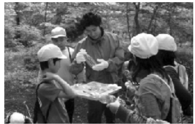
NPO法人から指導を受ける子供たち

本校は前述のように、教育活動において大変恵まれた環境下にある。子供たちには、実際に自分たちで調査することで、様々な発見や気づきが点として生まれる。その後の学習展開で、その点としての発見や気づきにつながり、実感を持った理解になっていく。座学だけの理解や、バーチャル体験ではない、本物の出会いがあってこそ、活動が意味付けられていくように思われる。