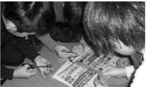
どんぐりの中のどんぐり虫を調べる子供たち

世界の多様性を実感することにより、自分たちの住んでいる地域がいかに素晴らしいところなのかを知り、この地域の豊かな自然を大切にしていこうという意識が高まっている様子が見られた。また、カナダ側から発表のあった「害虫による松の立ち枯れ」については、後日、子供たちから「ニュースで、日本でも同じ問題が話されていたよ」と反応があるなど、同じような環境問題が地球上どこでも起きているのだということを実感しているようだ。