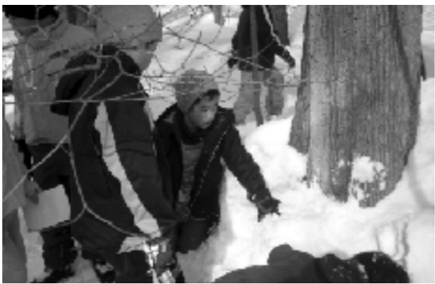
雪の上の生きものの痕跡を調べる

大人でも解決できない環境問題を子供たちに教えることだけが「環境教育」ではない。あまり大きな課題から扱うと「総論賛成、各論反対」の状態になり得る。まずは身近なことを調べて学習していくことにより実感を伴って理解し、「環境を愛し、大切にしていこう」という意識が育まれるということが大切だ。身近な環境に対しどう行動すべきかを考えることが、環境教育の入り口であると考え、そこから扱う範囲を次第に広げることが、最終的には「地球全体の環境」を考えられる人を育てていくことにつながると信じている。