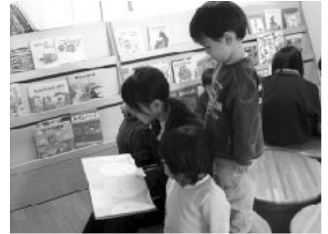
スノーフェスティバル 絵本読みきかせ

「環境」という言葉を前面に掲げることはしないで、まずは地域の方々との交流の機会を増やしていきたいと考えている。この交流により、自分たちの地域にある身近な施設などを素材にして活動の意義を考え、環境につながっているという意識をもつことや、生徒たちの視野を広げていくことを大切にしていきたい。高齢者福祉施設でのボランティア活動もできればと考えているが、近隣に施設がないため、現状ではなかなか難しい。