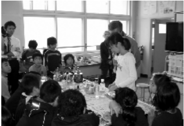
廃油を使ったキャンドル作り

まず7月に、公園の管理がどのように行われているか、西土木センターの方から教わり、公園のボランティア清掃や新ごみルールの学習を行った。地域の方々から「ごみのポイ捨てが一向になくならないため、これをなくすための効果的な看板を作ってほしい」「ごみのリサイクルとして、家庭から出る廃油を使ってキャンドルを作り、地域で毎年1月に行われる『アイスキャンドルin八軒中央』で灯してほしい」という2つの要望があった。これらを含め、自分たちの疑問に思うこと、やってみたいことをもとに主に8つのチームに分かれて取組んだ。