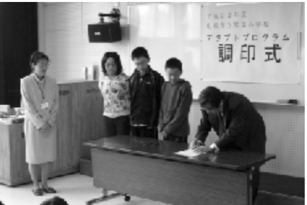
区役所での調印式