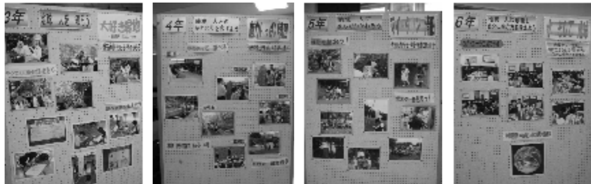
各学年の活動の様子

3・4・5年生で学んだことから、それぞれが問題意識をもつようになる。それは世界に通じる問題であり、「地域を大事にすることは、地球を大事にすること」に児童たちは気付いていく。