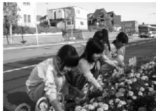
花の手入れをする子供たち

「ふれあい花壇づくり」で植えた花の世話などはPTAのほか老人会にも手伝ってもらい、地域の協力のもと、全校児童で取組んでいる。終了後には、「双葉会」の方々への感謝の気持ちを、絵やメッセージで表したカードを渡しているほか、教材園で作った野菜の試食会にも招待して、取組の効果を協力していただいた地域の方々とともに実感している。