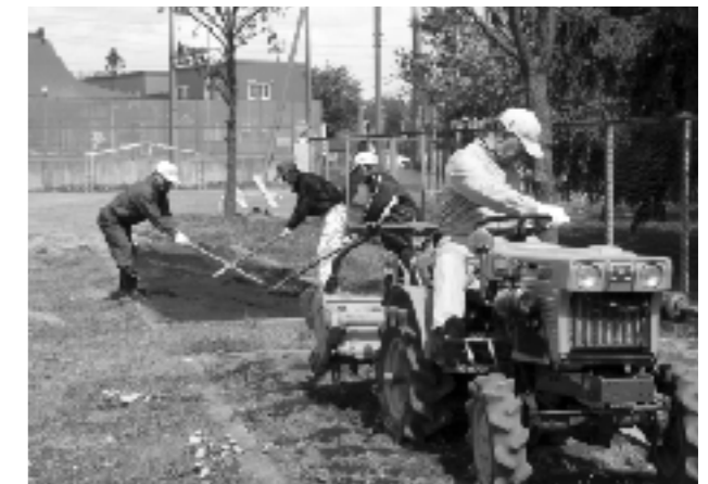
トラクターで畑おこし

今後は、感謝の気持ちを形にするだけでなく、一歩進んで、自分たちが地域のために何ができるか、環境のために何ができるか、ということを考えていけるようにしていきたい。