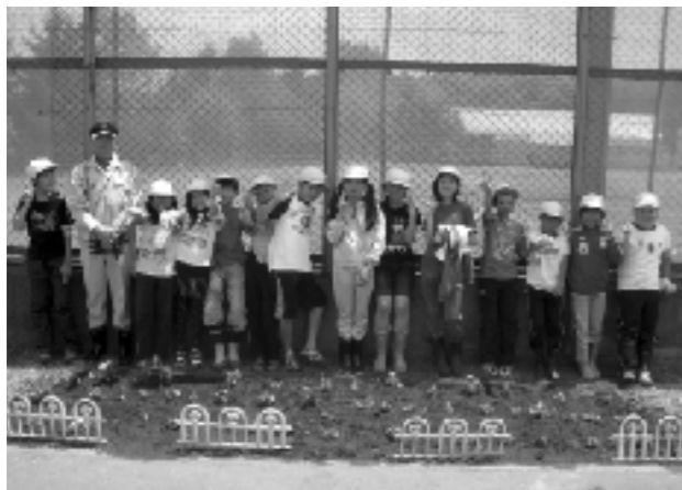
グラウンド横の歩道に植栽

毎年春に実施している学校周辺での清掃活動は、10年以上前から続いている取組である。例年、1～2年生は校地の周り、3～4年生は近隣のサイクリングロード、5～6年生は厚別南緑地を担当する。この清掃活動をとおり、児童はごみを捨てないこと、地域の環境を大切にすることなどを学んでいる。