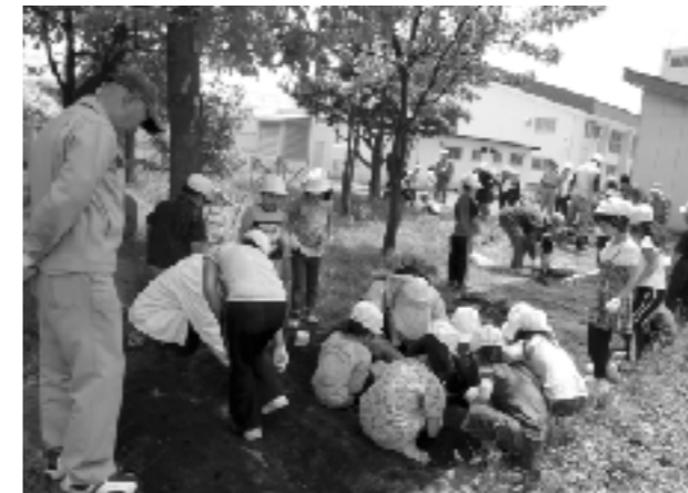
教材園で種植え指導