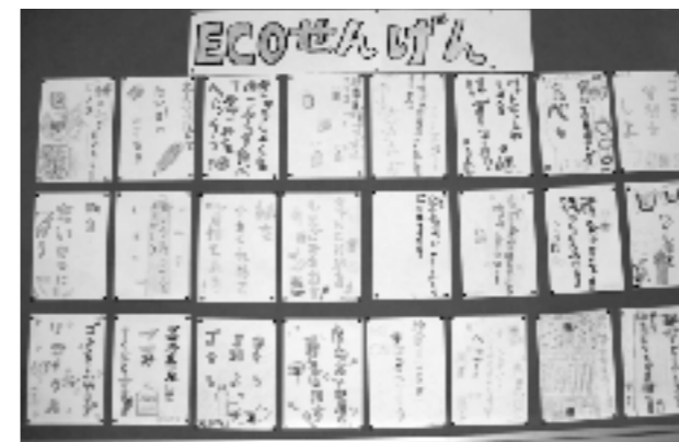
子供たちのエコ宣言

新学習指導要領の全面实施により、平成23年度からカリキュラムが変わり、「総合的な学習の時間」の時間数は減る。しかし、この「ごみダイエット研究室」は継続していきたいと考えている。また、「環境」に関する学習を全学年で実施するように、本校の教育課程の編成を行っていく。編成に際しては、どのような活動が子どもの興味・関心につながるのかを考え、もっと工夫や話し合いを重ねていきたい。