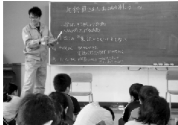
用務員さんへインタビュー

最終段階の 4 では、環境について意識付けを図るため、これから心がけていこうとしていることを「エコ宣言」として短冊に表している。また、その「エコ宣言」を一人一人が学年内で発表したり、ホールに掲示して全校に発信したりしている。