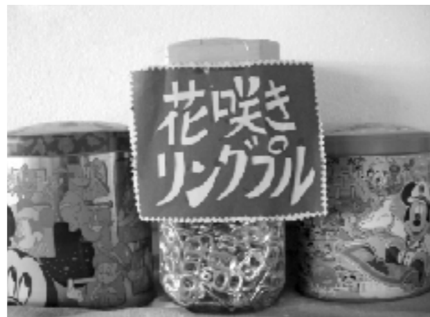
各クラスに置いているリングプル回収ボックス

リングプル収集は、生徒が家庭からもってくるものだけでなく、地域のコンビニなどにも回収箱を設置させてもらい、たまったら連絡をもらい回収している。地域の人たちもたまったものを学校まで持ってきてくれるなど取組に協力してくれている。