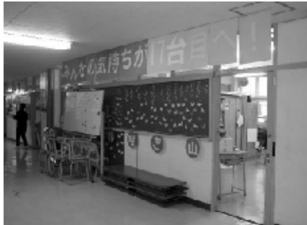
生徒会室前のようす

本校では、「人のためになり、身近にあるもので無理なく継続できる活動をやりたい」という生徒会長の呼びかけで、平成13年からリングプル収集活動が始まった。当初は校内だけの取組だったが、1校では車いすに交換するのに時間がかかることから、平成15年に区内の4校にも協力を呼びかけ、「チョボラ中学生の会」が発足した。現在は、区内のすべての中学校とひまわり分校が参加する活動となっている。チョボラは「ちょっとしたボランティア」の略であり、このようにひとつの区で連携して行うボランティア活動はめずらしく、生徒会サミットなどでも特色ある活動として紹介されている。