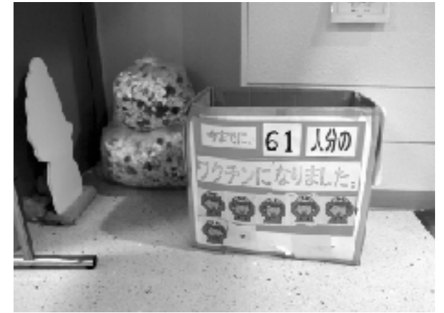
エコキャップ回収の様子

また、他学年と一緒に行動することで、上級生には先輩としての自覚も生まれ、下級生には先輩の行動をみて、「自分たちもよいことをやってみよう」という気持ちが芽生えている。この開校以来の伝統をこれからも受け継いでいきたいと思っている。