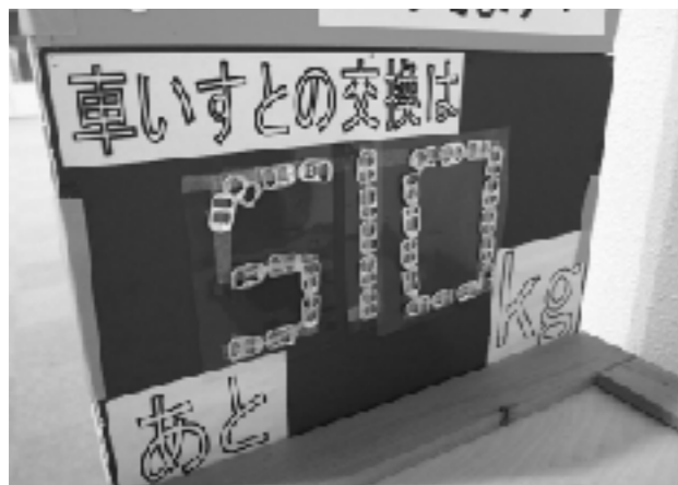
交換までの数量を表示

本校では、開校以来の伝統として学年間の交流が盛んで、遠足や清掃活動なども、1年生から6年生でグループを作り、他学年との交流を深めながら行っている。地球全体の問題である「環境問題」をテーマに交流を行うことで、学校全体に「エコ」意識が高まっている。