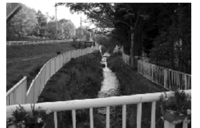
校舎前を流れる川

本校は森林での活動により、児童の中に「命のつながりを感じ、将来に渡って自然との共存に貢献できる感性」を育てている。児童は虫や季節の植物などに強く興味をもっているため、NPO法人森林遊びサポートセンター他との連携で行われるツリークライミングを「自然の中で遊ぶ」行動から「自分も自然の一部である」「鳥の目になり自然を見つめる」という意識に高めていきたいと考えている。このような取組により、社会に向けての知識、基盤作りをし、自分たちの活動の意味を考え、理解できるよう導いていきたい。