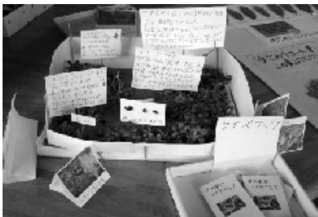
「学校林」の植物調べ

本校は「環境を地球規模で考え足下から行動する」を環境学習の柱とし、児童が6年間をとおして自然体験活動を行う体制ができている。児童全員が緑を