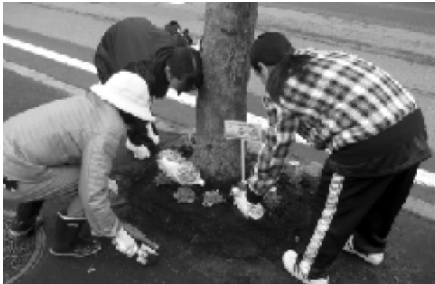
街路樹花壇に植花