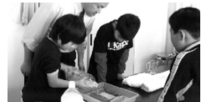
4年 古紙再生授業 紙すき体験①

紙のもとになる大きなロールなどを見学。実際に学校で回収した牛乳パック約600枚を、再生したトイレトペーパーに交換してもらった。これにより、ふだんの牛乳パックリサイクルの活動が「回収した後の過程」や「再生した製品」とつながり、牛乳パックのリサイクルについて深くとらえることができた。