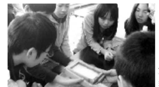
4年 古紙再生授業 紙すき体験②

4年生は牛乳パックを利用した紙すき体験で、6年生は、回収された牛乳パックが再生される場所を見学したことで、毎日の回収作業の「結果」を学ぶことができた。実際にリサイクルを体験・観察したことで、リサイクル活動の意義を理解し、日頃の牛乳パック回収活動にも積極的に取り組むようになっている。