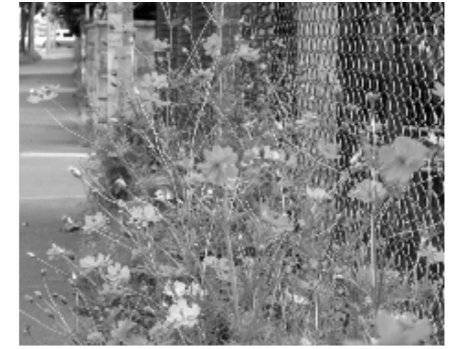
フェンス花壇のキバナコスモス

本校のフェンス花壇でキバナコスモスが見事に咲いているのを見た地域住民が、秋の種採取の時に種をもち帰り、それぞれの自宅や幹線道路の街路樹花壇に植えるようになり、キバナコスモスは地域一帯に広がっている。このように、学校から始まった取組が地域に広がったようすは、児童にとっては誇りともなり、また花を通じて地域と学校がより近づくことにもつながった。