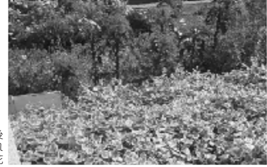
植栽後 手入れされた花

花の苗はPTAの協力なども得て購入しているが、学校予算が年々減っており、また総合的な学習の時間も減っていくので、ゲストティーチャーの招へいや出前授業を取り入れるなど、工夫して様々な活動に取り組んでいきたい。