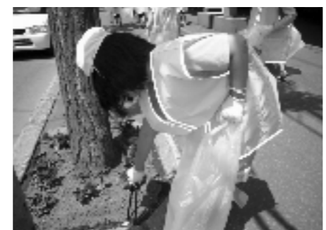
清掃活動のようす

しかし、生徒数が減ってきており、活動できる範囲が限られてしまうことが課題である。保護者のボランティアを増やすなど地域の協力も検討している。時間も限られているため、準備を効率的に行うなどの調整・改善が必要であり、コースやスケジュールの調整、安全確保など配慮する点も多い。また、子供たちが「やらされ