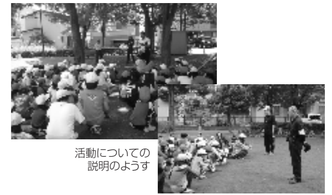
活動についての説明の様子

このように清掃活動での低学年との関わりをとおして、自主的な行動とともに責任感が育まれている。