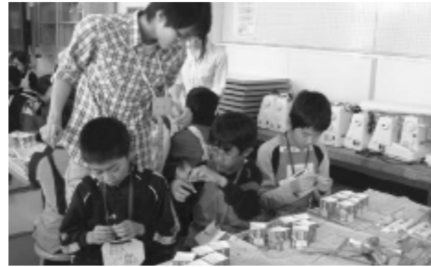
キャンドルづくりの様子①

招いて実施した。「キャンドルづくりを通じて地域との交流を深めたい。」という学生の願いにも沿った活動となった。