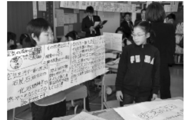
エコプロジェクトの発表

環境を守る取組は、簡単に結果が目に見える活動ではないが、今後とも積極的に取り組んでいきたいと考えている。