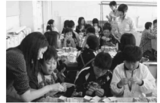
キャンドルづくりの様子③

言葉での押しつけではなく、なぜ、環境を大切にするのか、体験をとおして伝えることが重要だ。今回、5年生の子供たちは、廃油という「ごみ」になるものが、工夫によって、キャンドルという「使えるもの」に形を変えることを、身をもって体験することで、まさに「実感」を得ることができ、大変有意義な取組となった。