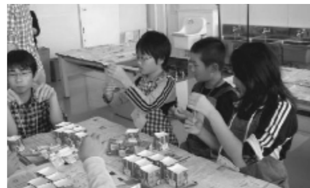
キャンドルづくりの様子②

キャンドルが固まるまでの時間を利用し、「家庭から出るごみはどのようなものがあるか」「ごみをできるだけ少なくするためにはどうしたらよいか」などについて、学生がパワーポイントで自主制作した資料を使って説明。