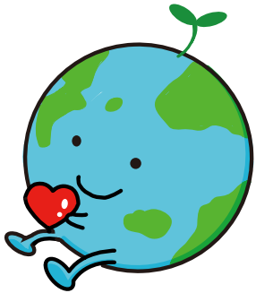
未来の札幌を考える 【環境】イメージキャラクター 「ちっぎゅん」