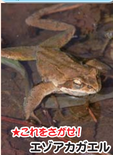
★これをさがせ! エゾアカカエル