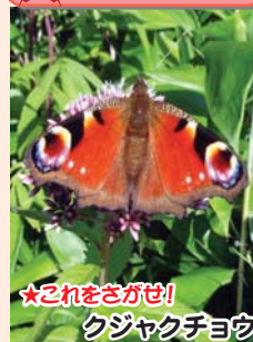
★これをさがせ! クジャクチョウ