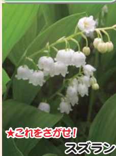
★これをさがせ! スズラン