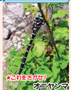
★これをさがせ! オニヤンマ