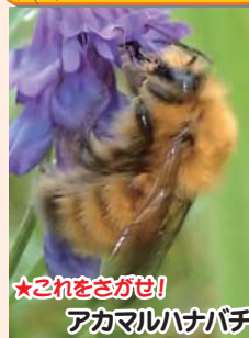
★これをさがせ! アカマルハナバチ