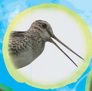
♪カマコウ ♪カマコウ