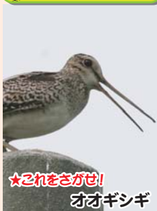
★これをさがせ! オオギシギ