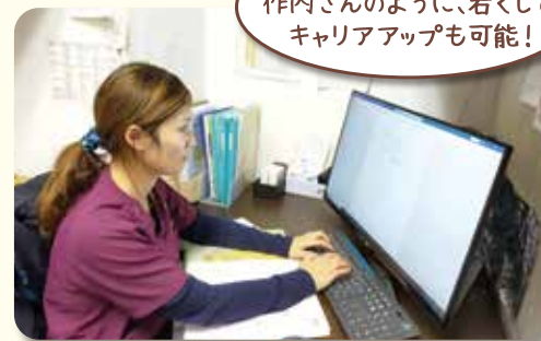
頑張り次第で作内さんのように、若くしてキャリアアップも可能！