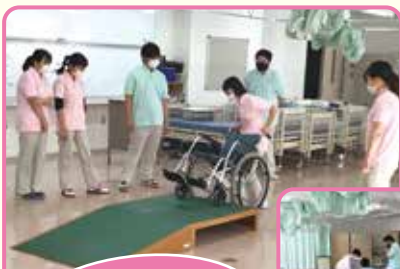
養成校にはこんな実習設備が！