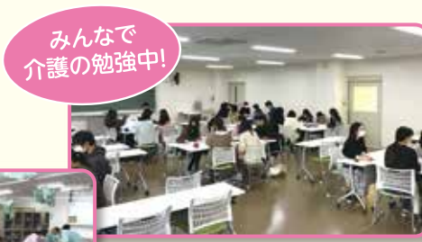
みんなで介護の勉強中！